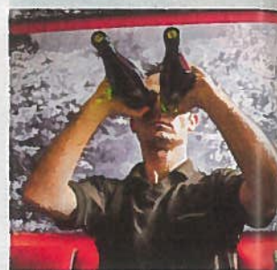
„Wein-Kultur-Bar“ Genuss für alle Sinne in Dresden