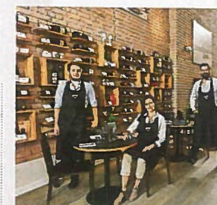
„Tantris Natural Winebar“ Seit Juni in der Münchner City

„Westbar“, Myliusstr. 48, Tel. 0 69/71 71 98 45, www.westbar-frankfurt.de