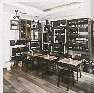
„Cordobar“ Deutsch-österreichischer Hot Spot in Berlin

„PIUS Weinwirtschaft“, Hegestraße 14-16, Tel. 0 40/46 09 53 10, www.pius-weine.de (auch in Keitum/Sylt, Am Kliff 5, Tel. 0 46 51/8 89 14 38)