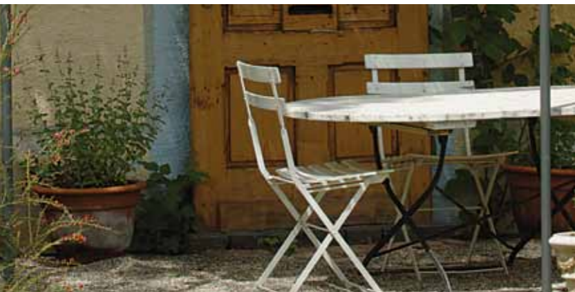
HOF – GARTEN