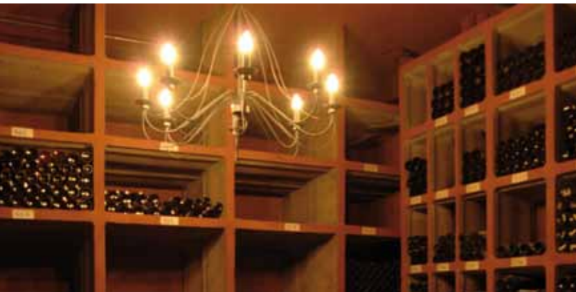
KELLEREI IM RHEINGARTEN