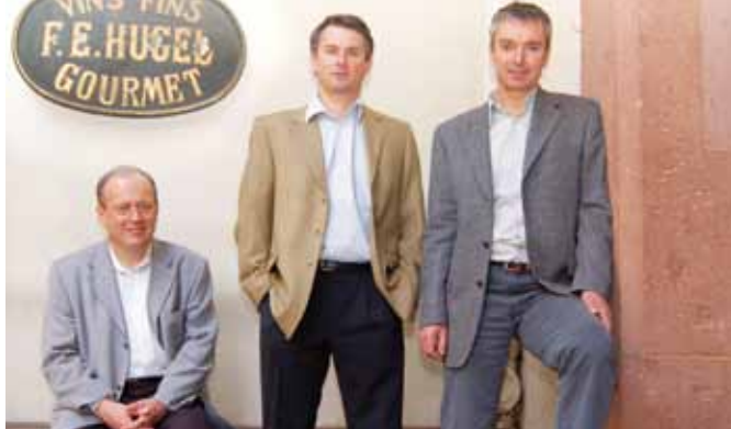
© Etienne, Marc und Jean-Philippe Hugel