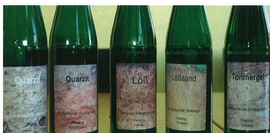
Die ersten trockensten Versuchsweine der FA Geiesenheim zum Thema Terroir: Boden kann man schmecken!

zigen jugendlichen Stadium mit Kraft, Alkohol spürbar.