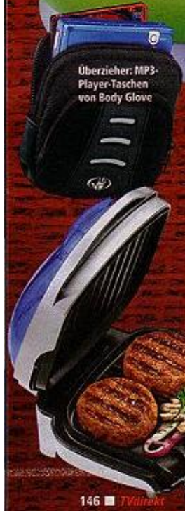
Überzieher: MP3-Player-Taschen von Body Glove

Erst fettfrei schleimen, dann stochem: der George-Foreman-Grill und der Toothpick-Spender machen's möglich