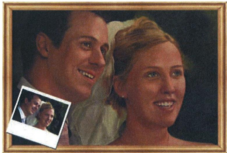
FOTO-GEMÄLDE FÜR BESONDERE ANLÄSSE: Wer einen besonderen Moment nicht nur als Foto festhalten möchte, kann bei www.gallery.net individuelle Ölgemälde, Zeichnungen, Pop-Art-Bilder und vieles mehr nach eingeschickten oder digital versandten Fotos anfertigen lassen; Tel. 08 00-1 01 09 35

LICHTKUNST FÜR BESONDERE RÄUME: Bei „Derksen Lichttechnik“ können Sie Ihren Liebsten individuelle Schablonen mit Bildern, Motiven oder Texten fertigen lassen, die der leistungsfähige Miniprojektor Gobo TopPlus dann als Kunstwerk an die Wand wirft; www.derksen.de , Tel. 02 09-98 07 00